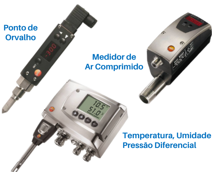
Ponto de Orvalho

Na Testo você encontra transmissores para transformação de grandezas de medidas. Encontre a solução ideal na grande gama de ofertas.